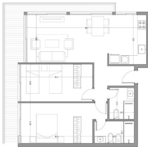
PLANTA - UNIDAD 101 ESC. 1:50

TIPOLOGÍA 2 DORMITORIOS UNIDADES: 101-401 / 102-402