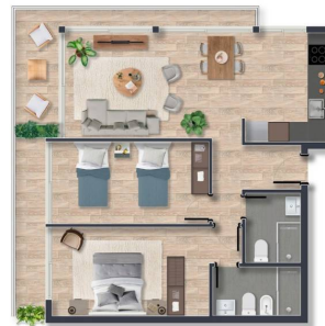
PLANTA - UNIDAD 101 ESC. 1:50

TIPOLOGÍA 2 DORMITORIOS UNIDADES: 101-401 / 102-402