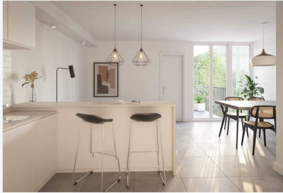
Imágenes meramente ilustrativas