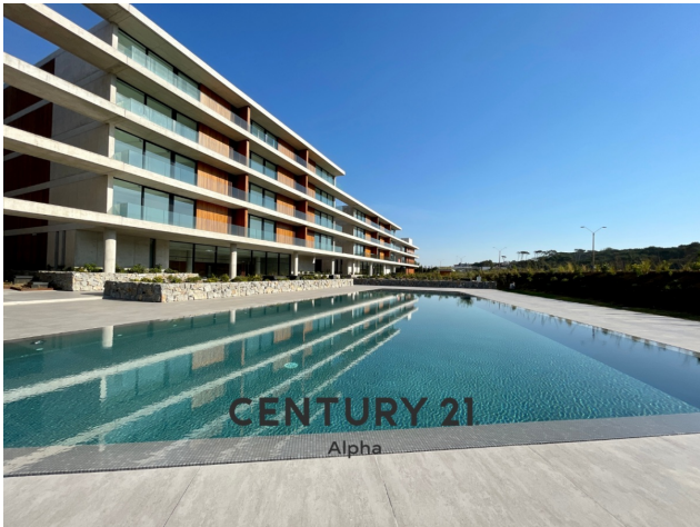
CENTURY 21 Alpha