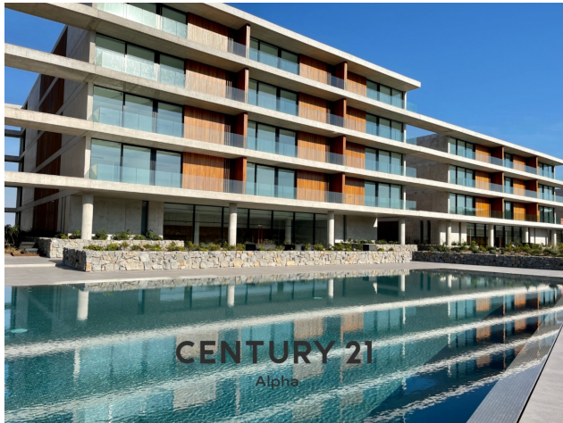
CENTURY 21 Alpha