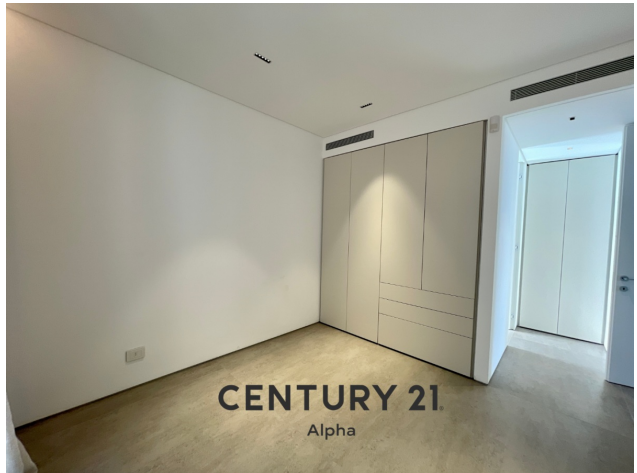
CENTURY 21 Alpha