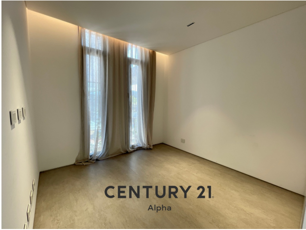
CENTURY 21 Alpha