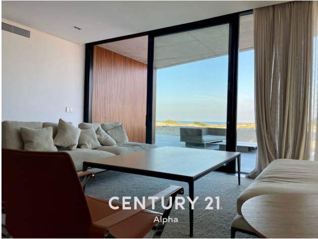
CENTURY 21 Alpha