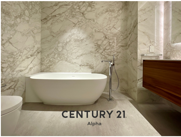
CENTURY 21 Alpha