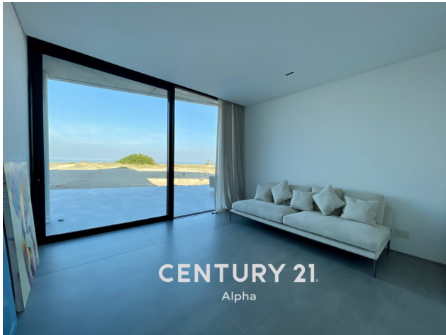
CENTURY 21 Alpha