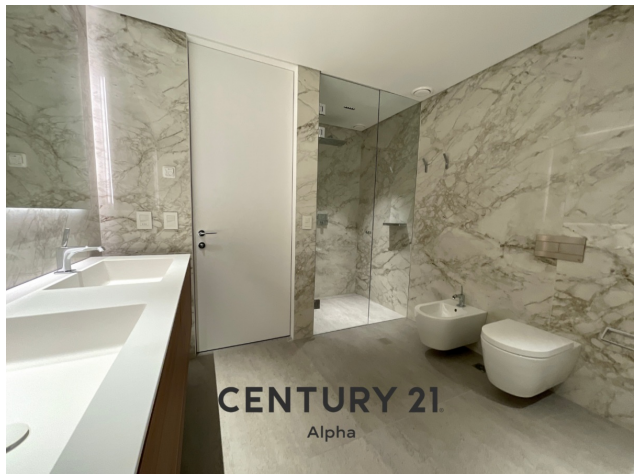
CENTURY 21 Alpha