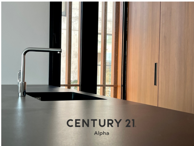
CENTURY 21 Alpha