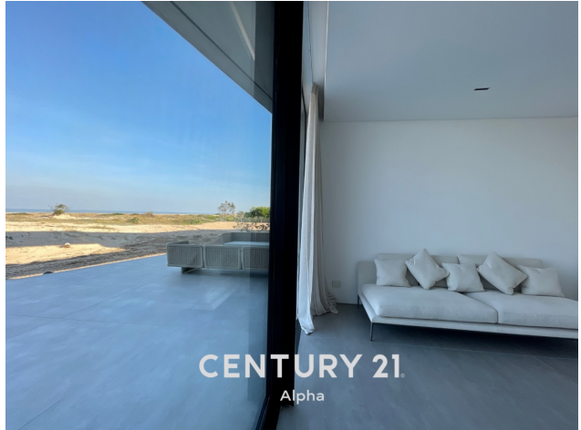
CENTURY 21 Alpha