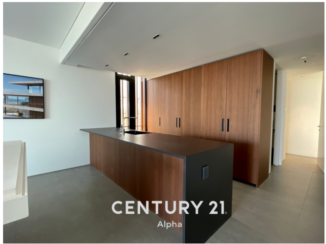
CENTURY 21 Alpha