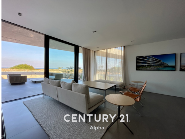
CENTURY 21 Alpha