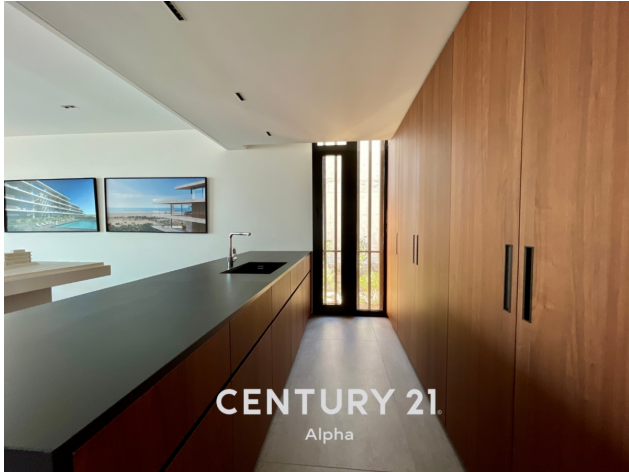
CENTURY 21 Alpha