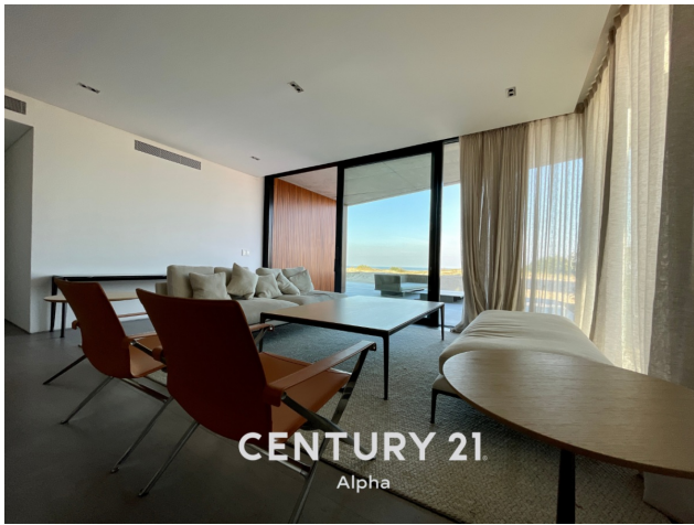
CENTURY 21 Alpha