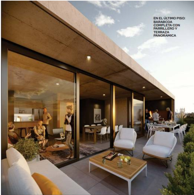
EN EL ÚLTIMO PISO: BARABCOA COMPLETA CON PARRILLERO Y TERRAZA PANORAMICA