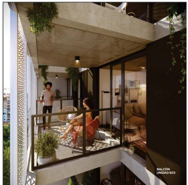
BALCÓN UNIDAD 803