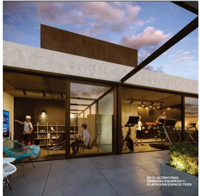
EN EL ÚLTIMO PISO: GIMNASIO EQUIPADO Y PLAYROOM/ESPACIO TEEN