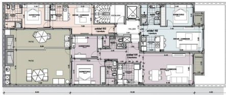
planta nivel 1