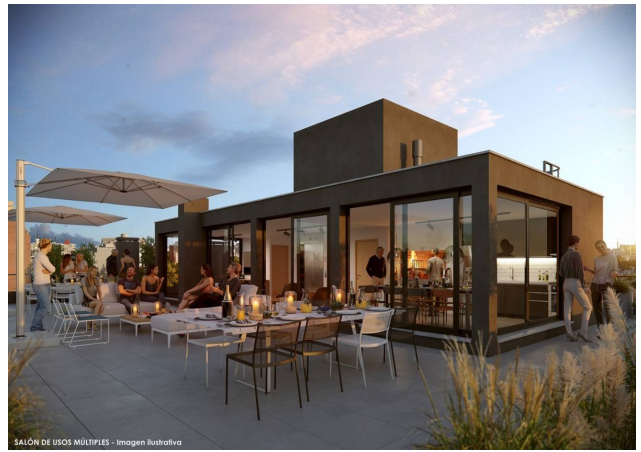
SAIÓN DE USOS MÚLTIPLES - Imagen Ilustrativa