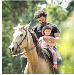
PUERTO QUETZAL - CHACRAS & OLIVOS