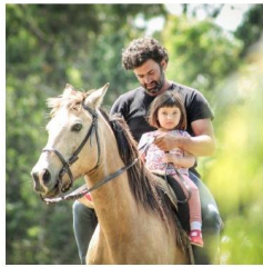
PUERTO QUETZAL - CHACRAS & OLIVOS