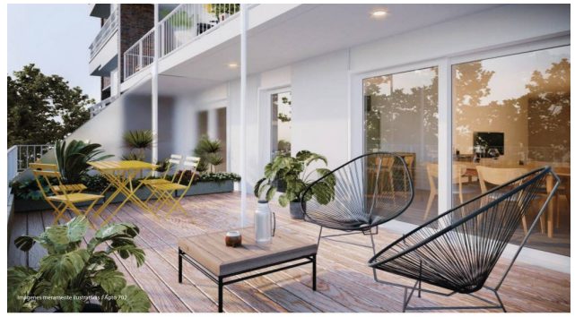
AMENITIES - TORRE 2 / NIVEL 4