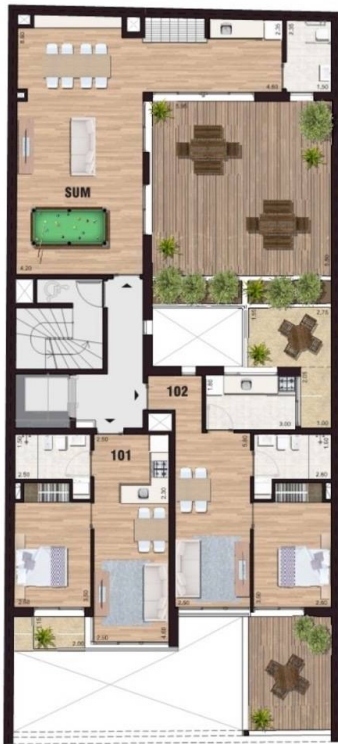
UNIDADES 1 DORMITORIO