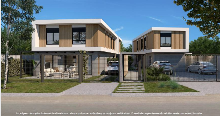
Las imágenes, áreas y descripciones de las viviendas mostradas son preliminares, estimativas y están sujetas a modificaciones. El mobiliario y vegetación no están incluidos, siendo a mero efecto ilustrativo.