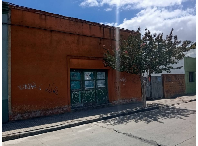
Century 21 East Coast