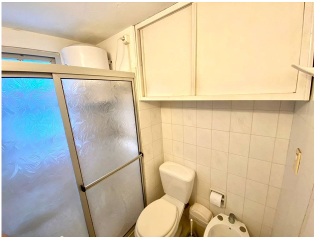
Av. Roosevelt y Av. Orlando Pedragosa Sierra, Punta del Este, Maldonado